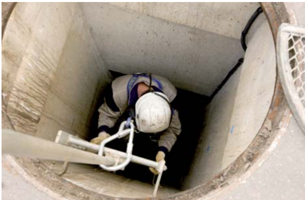
Intervention sur un poste de relèvement.