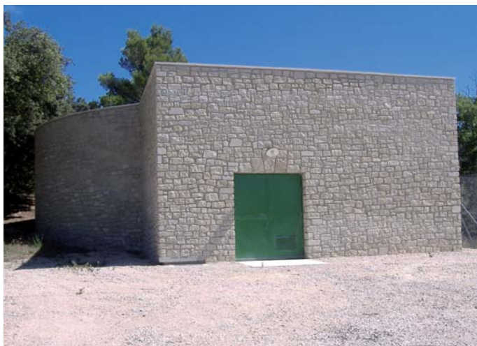
Réservoir d'eau potable de Venasque.